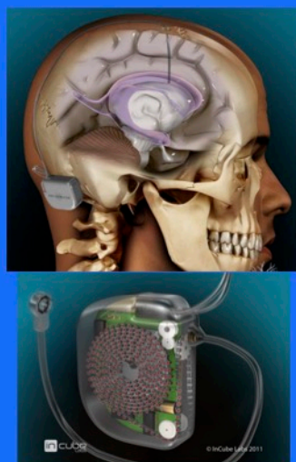
てんかん防止用体内植 え込み式薬剤投与装置