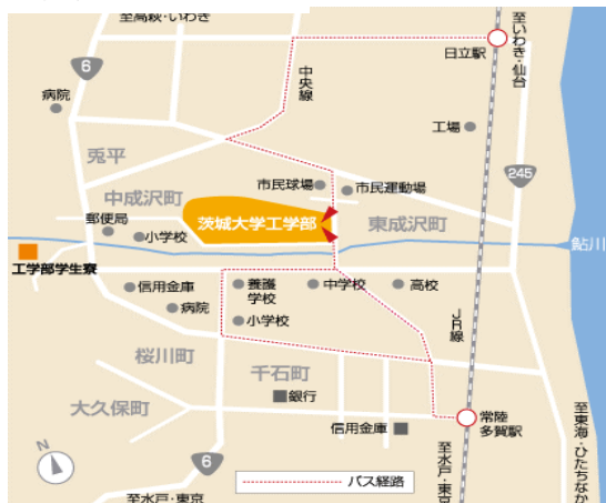
日立地区(工学部)配置図